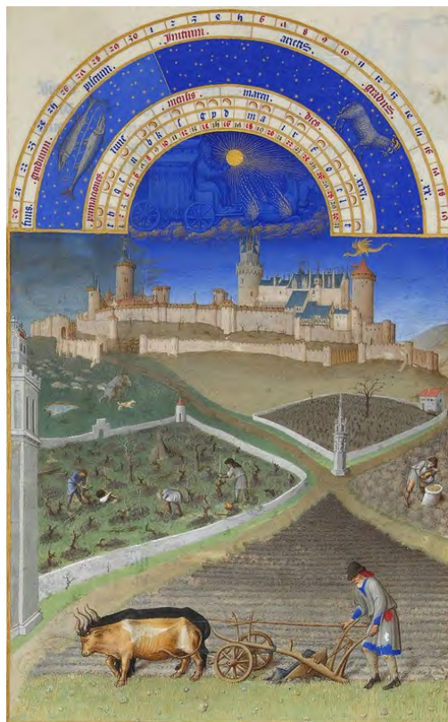
château de Lusignan Les Très Riches Heures du duc de Berry

De par son intérêt patrimonial historique , la promenade de Blossac aménagée au XVIII e par le Comte de Blossac, intendant du Poitou, sur la base de l'ancien château féodal, a été classée en 1935.