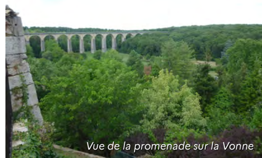
Vue de la promenade sur la Vonne

La terrasse supérieure est plus importante. Une large allée centrale orientée nord/est sud/est traverse la plateforme. De part et d'autre 2 allées parallèles avec double alignements de tilleuls complètent l'allée centrale qui est aussi une partie de la Voie de Tours chemin vers St Jacques de Compostelle (Via Turonensis- GR 655 – Unesco). Quelques bancs sont installés au pied des tilleuls. Sa situation offre un panorama exceptionnel. De part et d'autre de ces allées, des belvédères surplombent et offrent des vues d'un côté sur le cirque de la Vonne et sa vallée, la forêt, le viaduc de la voie ferrée ainsi que sur le bourg ancien de Lusignan; de l'autre sur l'extension urbaine récente de Puy Berger et les alentours.